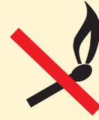
Allumer un feu