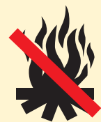
Feu de camps